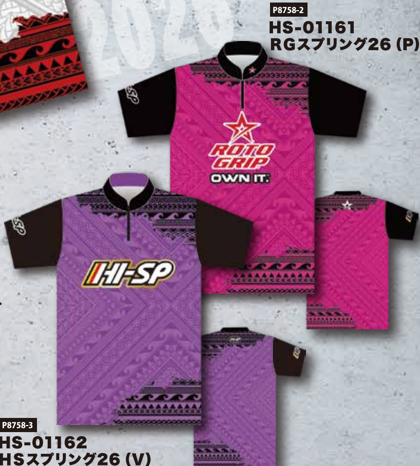
P8758-2 HS-01161 RGスプリング26 (P)