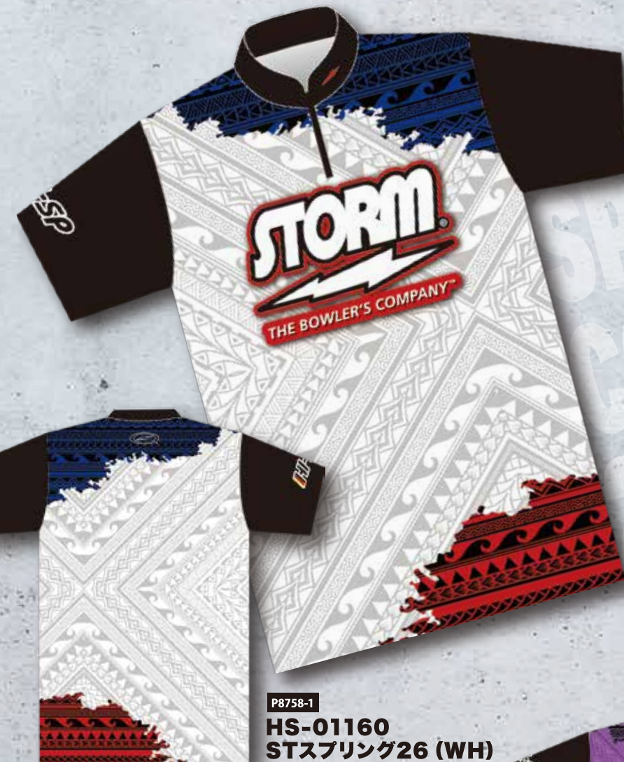
P8758-1 HS-01160 STスプリング26 (WH)

サモアやマオリの伝統的な紋様がデザインされた HI-SPスプリングコレクション2026ウエア。 「戦士の守護」や「勝利への意志」を意味する幾何学模様が、 あなたのボウリング・スタイルに 圧倒的な存在感とパワーを与えます。 高い機能性と、レーンで目を引く独創的なデザイン。 この春、ハイ・スポーツ社と共に、新たな高みへ。