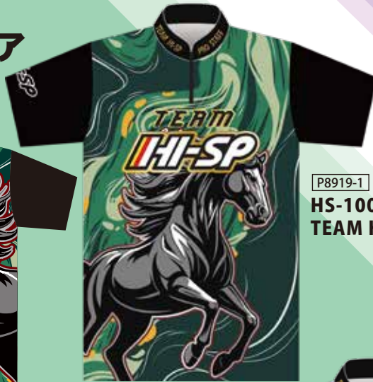
P8919-1 HS-10041 TEAM HI-SPギャロップ(GR)