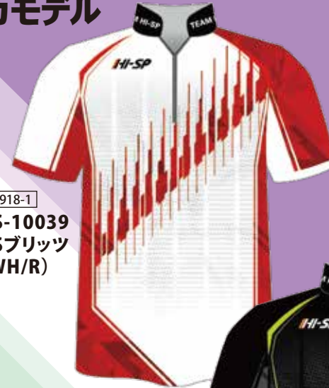
P8918-1 HS-10039 HSブリッツ (WH/R)