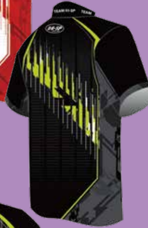
P8918-2 HS-10040 HSブリッツ (BK/GR)