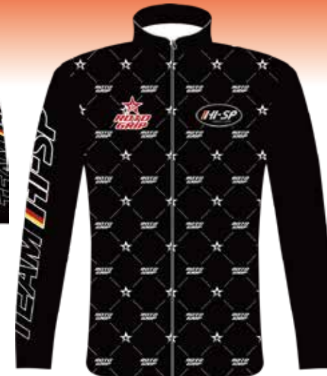
SH-543 RGライトジャケット (BK)