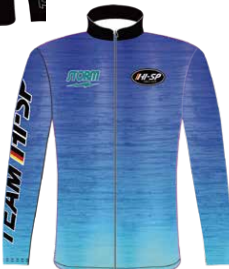
SH-542 STライトジャケット (BU)