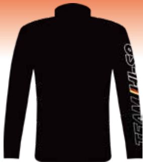
SH-541 STライトジャケット (BK)