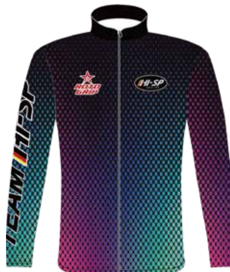
SH-544 RGライトジャケット (V)