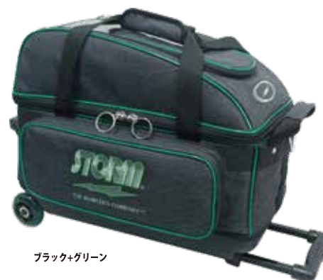
ブラック+グリーン