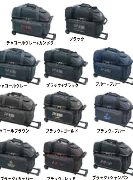
チャコールグレー+ガンメタ