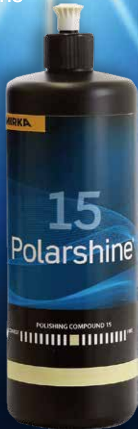
ポーラーシャイン15 P-789-2 内容量:1L