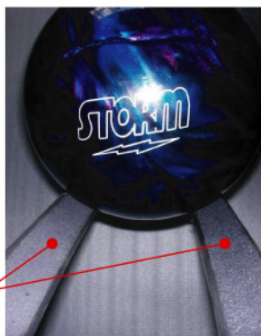
ロケットレール拡大写真