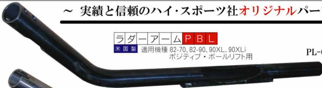
ラダーアーム P B L

米国製 適用機種 82-70、82-90、90XL、90XLi ポジティブ・ボールリフト用