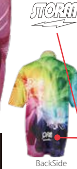
HS-01131 ST サンシャイン(レインボー)