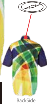
イエロー HS-01130 ST サンシャイン(Y)