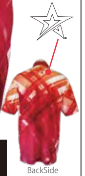
ピンク HS-01132 RG サンシャイン(P)