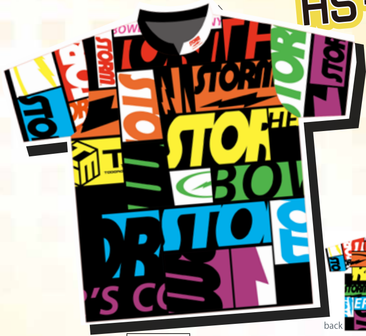
P8101-1 SH-533 スコープ (レインボウ)