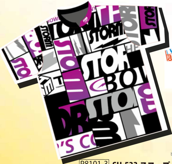
P8101-3 SH-533 スコープ (パープル/グレー)