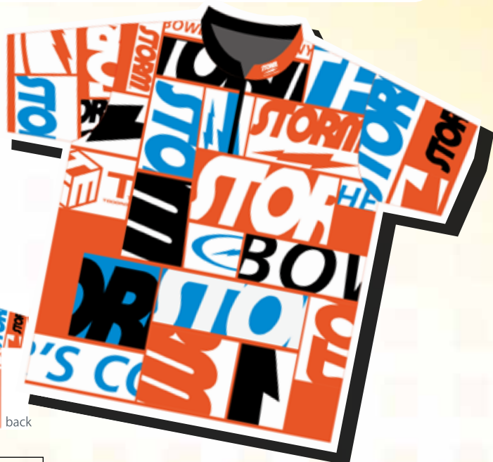
P8101-2 SH-533 スコープ (オレンジ/ブルー)