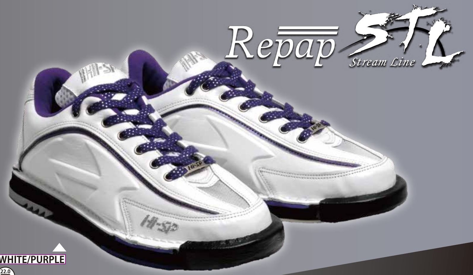
WHITE/PURPLE 22.0 28.0