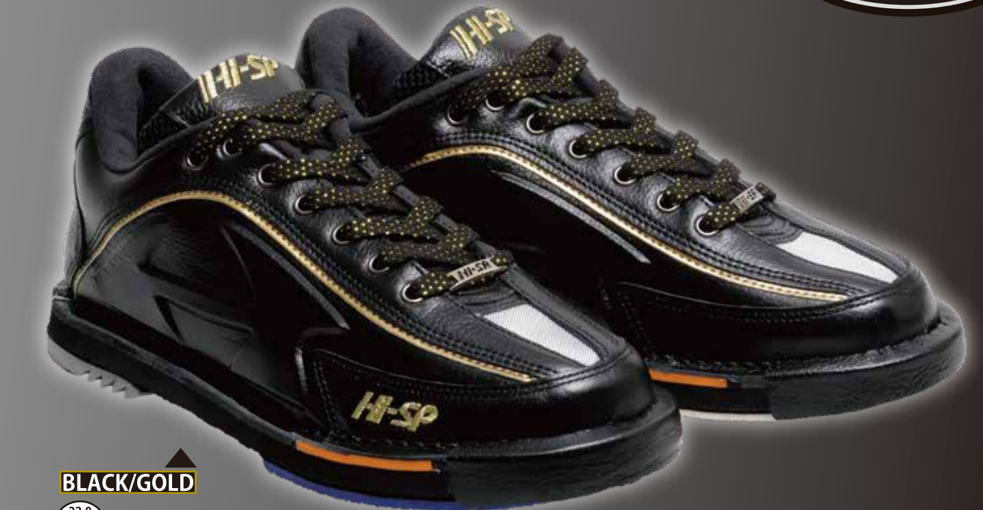
BLACK/GOLD 22.0 29.0 30.0