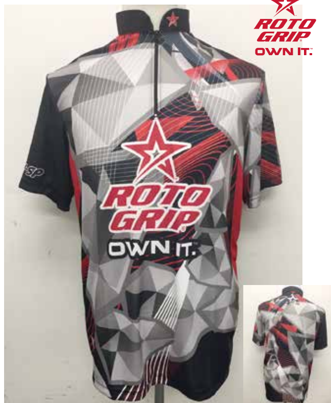
■ HS-01074 R Gジオメトリー (BK)

※右袖にHI-SPロゴマークもプリントされています。 Made in Philippines