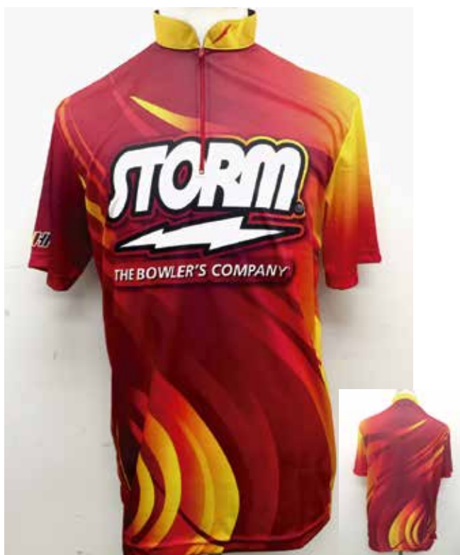
■ HS-01072 S Tジオメトリー (R)