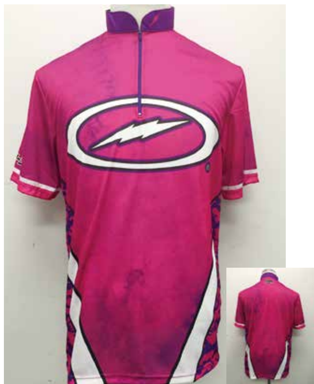
■ HS-01073 S Tジオメトリー (V)