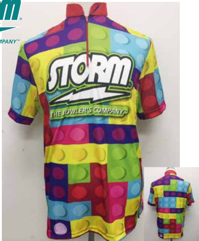
■ HS-01071 S Tブロック