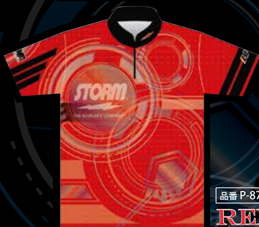
品番 P-8702-3 RED