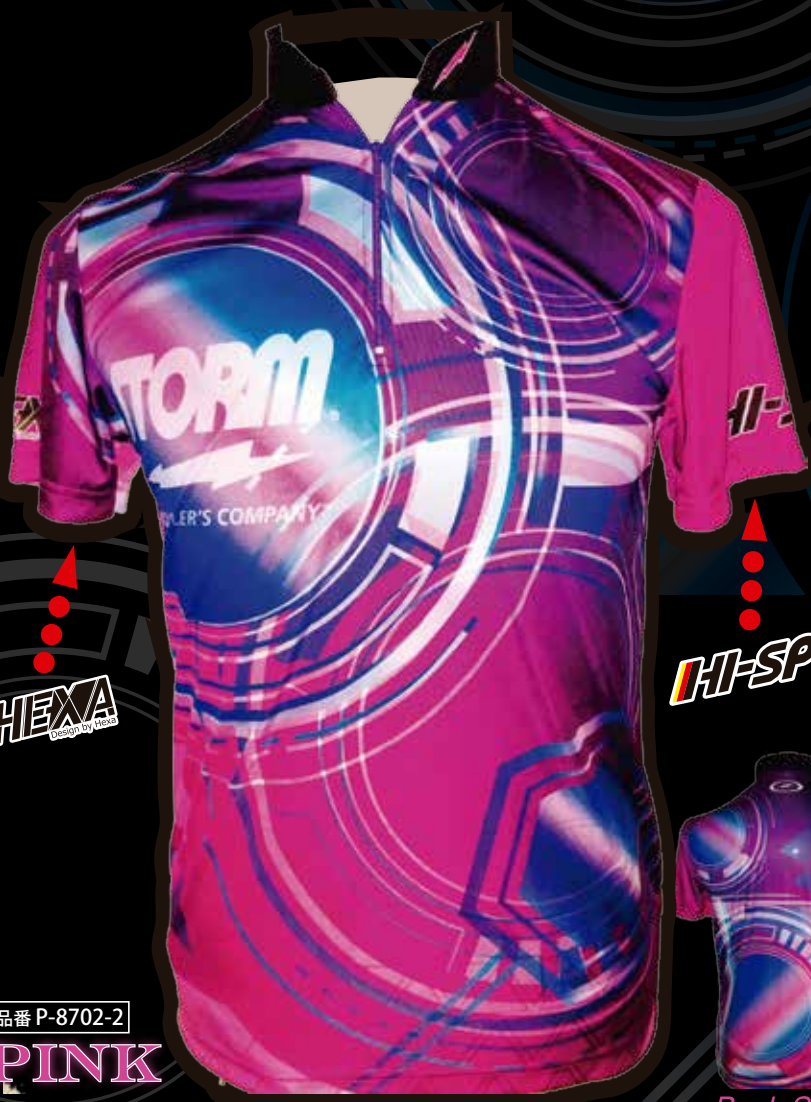
品番 P-8702-2 PINK