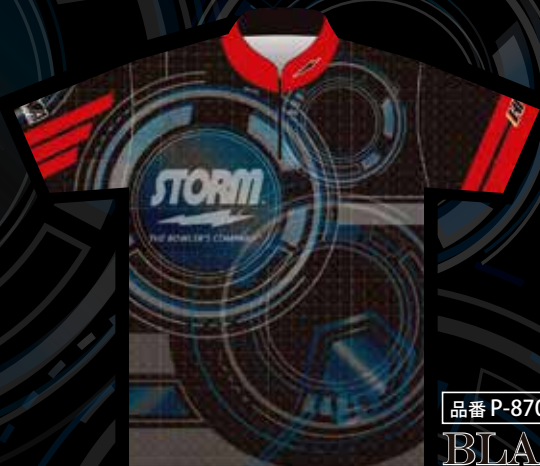
品番 P-8702-1 BLACK