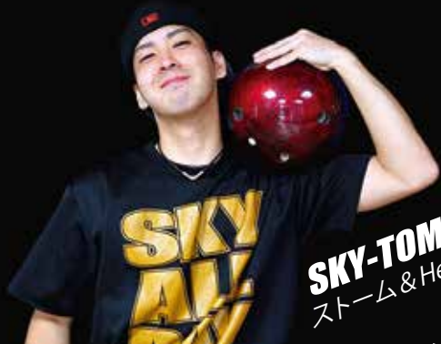
クリエイトチームHeXa代表 スカイトモ