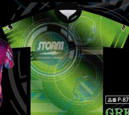
品番 P-8702-4 GREEN