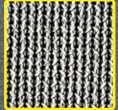
シリコンカーバイド研磨粒子が付着した研磨面の拡大図

アブラロンパッドは、サーフェイスラボやSTORMサーフェイスファクトリーなどの自動表面処理マシン専用の多機能研磨剤です。